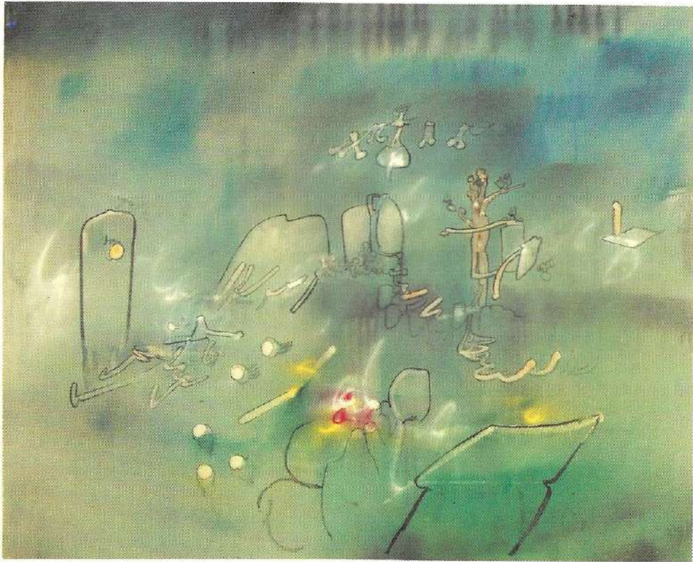
S/T. 1968, óleo s/tela. 84 x 104 cm.