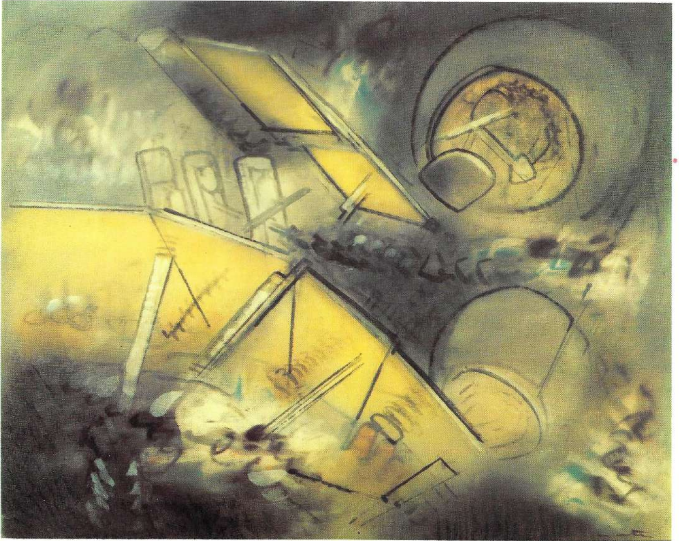
S/T. 1961, óleo s/tela, 81.5 x 102 cm.