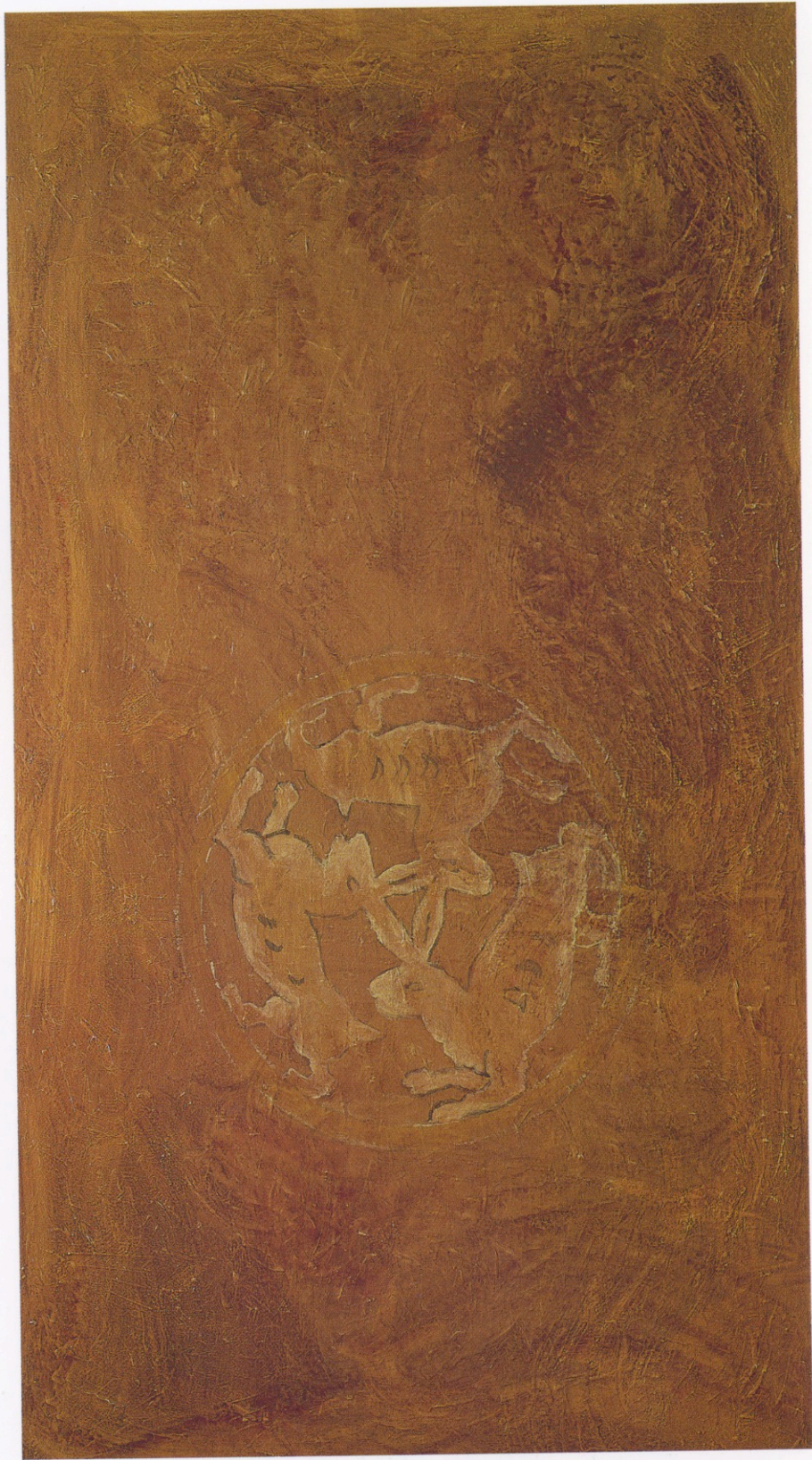
Todos giran en el mismo sentido. 1995/96